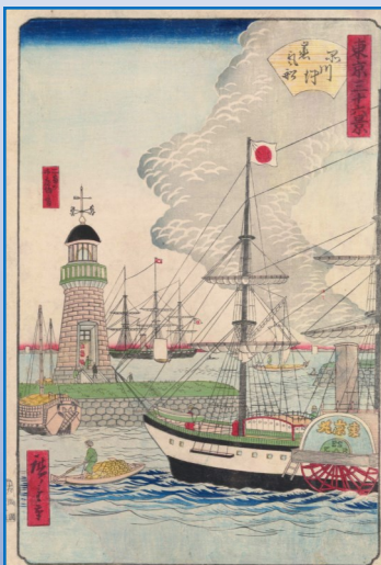
東京三十六景 品川沖蒸気船