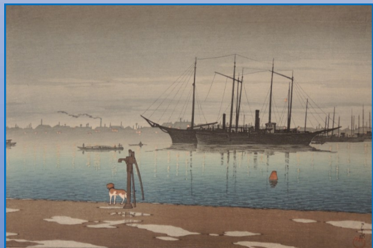
東京二十景明石町の雨後（船の科学館所蔵）