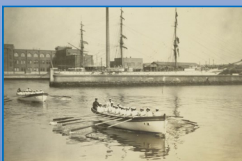
昭和八年 短艇実習と明治丸