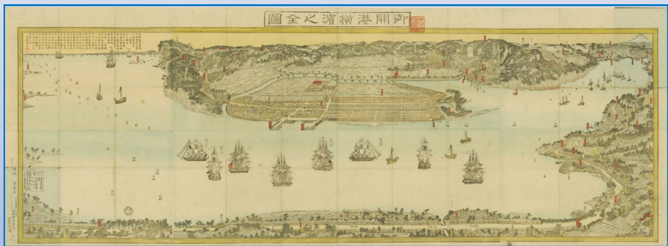
御開港横浜之全図