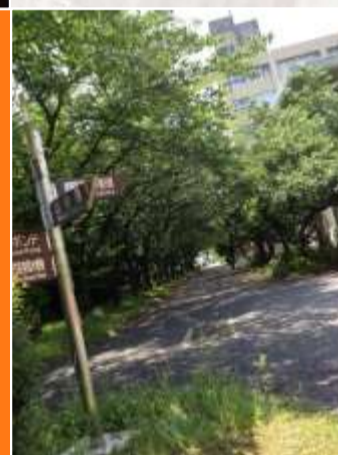
豊かな緑に 恵まれた環境