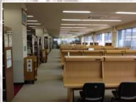
全93席の 個人ブース