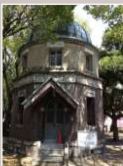
学内には 文化財も