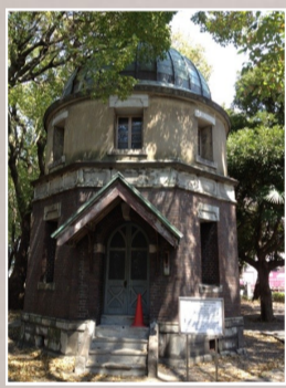
学内には 重要文化財も