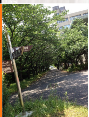
豊かな緑に 恵まれた環境