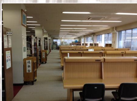
全93席の 個人ブース

7/20(金)～8/24(金) 月～金 8:45～17:00 7/31(火)・8/14(火)・8/15(水)は休館日