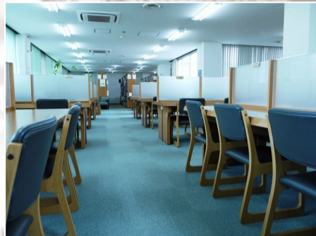
全130席の 個人ブース