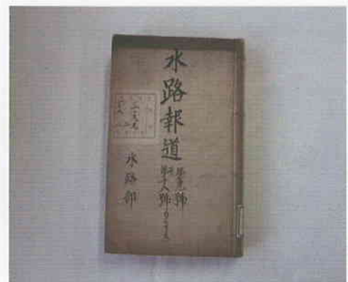
水路報道 (第9号) 国立公文書館蔵