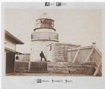
六連島燈台 (下関) 霞会館蔵