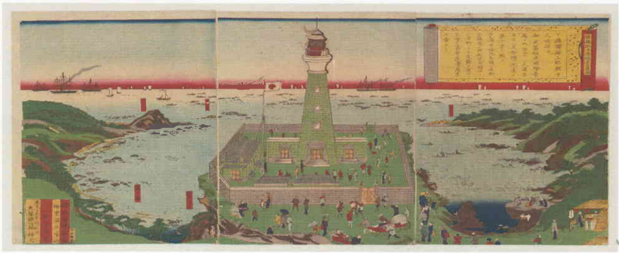
総州銚子港燈臺畧圖 歌川國輝(二代)画

明治丸が明治の初め燈台整備業務や物資の補給のため巡廻した燈台について、錦絵、当時の写真、現在の写真、そして巡廻記録等の関連資料などにより明治丸の活躍を紹介します。