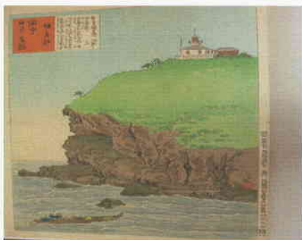
日本名勝図会 観音崎 小林清親画

明治丸が明治の初め燈台整備業務や物資の補給のため巡廻した燈台について、錦絵、当時の写真、現在の写真、そして巡廻記録等の関連資料などにより明治丸の活躍を紹介します。