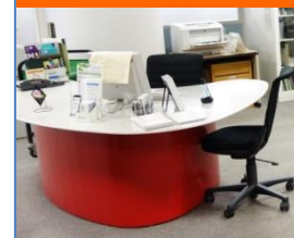
アシスタントカウンター