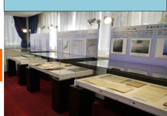
コレクションの魅力に出会う展示ギャラリー