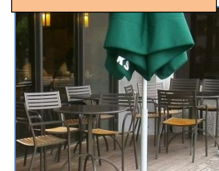
リフレッシュエリア（飲食可能）