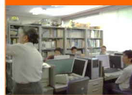
図書館員による文献検索ガイダンス