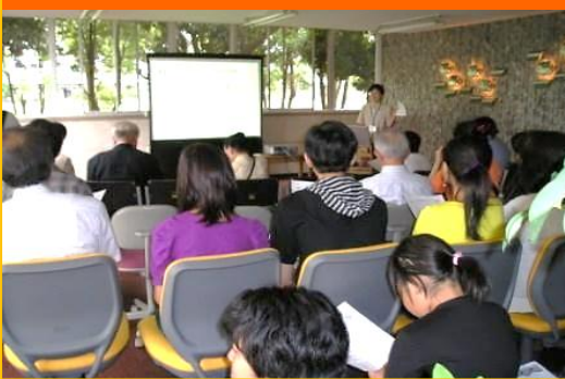
サイエンスカフェ