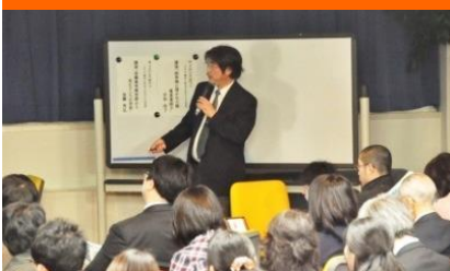
セミナー、プレゼン練習