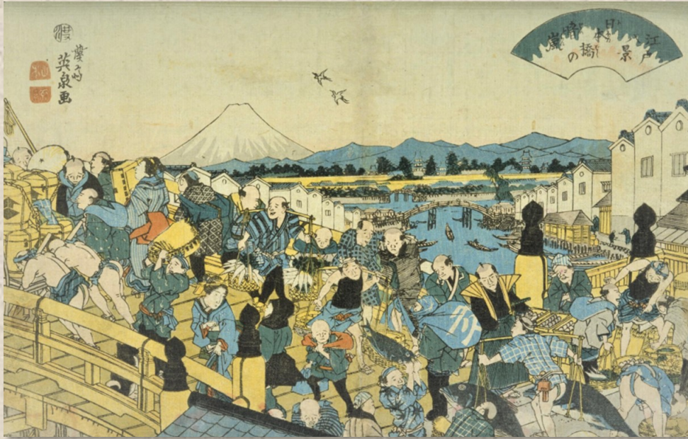
溪斎英泉「江戸八景 日本橋の晴嵐」